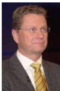
Guido Westerwelle FDP-Vorsitzender

Wir haben uns politisch nicht isoliert [mit Haltung zum Anriff auf den Irak], sondern ich glaube, dass es der klare Kurs ist der rot-grünen Regierung, dass wir inzwischen auch in den europäischen Nachbarstaaten, in der amerikanischen Bevölkerung sehr viel Zustimmung haben in dem Versuch, die UN-Resolution nicht militärisch umzusetzen [...] Wir machen alles das, was innerhalb der NATO-Verpflichtung von uns erwartet wird [...] Zweitens werden wir alles machen, was unterhalb einer direkten Beteiligung liegt, das heißt, wir werden auch der Türkei helfen, aber wir werden dies im Rahmen von dem tun, was auch gedeckt ist. Alles, was eine weitere Auslegung betrifft, würde bedeuten, dass man im Bundestag darüber entscheiden muss. Und ich kann nur nochmal sagen, für mich ist es keine Wahlkampffrage, sondern wir sehen die Bedenken in der Bevölkerung, in Europa, in Amerika und ich bin überzeugt, dass diese Bedenken ganz klar politisch auch auf den Punkt gebracht werden müssen. Hätten wir das nicht getan, hätten wir längst oder möglicherweise längst eine Brückierung der Vereinten Nationen.