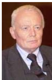
Arnulf Baring Historiker

Ich lasse die Entscheidung über Kinderbetreuung in Priorität eins bei den Eltern, das ist auch die Verfassungsgrundlage. Und dann lasse ich bei den Eltern auch genügend Geld, das wahrnehmen zu können [..] Es gibt nämlich neben der Ganztagschule auch vielleicht Eltern, die sagen, dass sie am Nachmittag sich mit ihren Kindern länger beschäftigen wollen und sie nicht nur bei anderen abgeben wollen. Auch dieses Bild ist ein Bild, das unsere Gesellschaft prägt. Sie nehmen denen aber die finanziellen Möglichkeiten dazu [...]