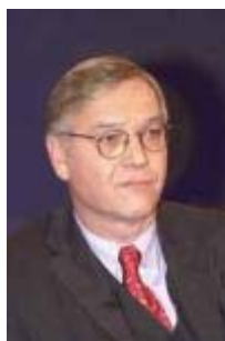
Ludolf von Wartenberg Hauptgeschäftsführer BDI

Deshalb [wegen der höheren Lebenserwartung durch bessere medizinische Versorgung] ist auch die Forderung, die Ausgaben im Gesundheitswesen zu drosseln, zu senken, völlig absurd. Die müssen steigen, wenn die Bevölkerung immer älter wird und wenn der medizinische Fortschritt so rasant geht. Wir werden meines Erachtens die Rentenprobleme nur lösen können mit einer Verlängerung der Arbeitszeit. Das muss natürlich flexibel gestaltet werden. Wer durch körperlich schwere Arbeit mit 50 Jahren ruiniert ist, der muss mit 50 Jahren gehen. Und es muss auch möglich sein, dass jemand, der körperlich leistungsfähig ist, auch über 65 arbeitet. Da brauchen wir also wesentlich mehr Flexibilität. Aber im Schnitt wird die Arbeitszeit verlängert.