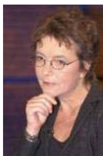
Angelika Beer Parteivorsitzende Bündnis 90/Die Grünen

Das Entscheidende ist doch, dass Deutschland Einfluss hat auf europäische und internationale Entscheidungsfindung [...] Und den Vorwurf, den ich Ihnen [zu Angelika Beer] und Ihrer Koalition mache ist, dass wir uns aus dieser Solidarität zurückgezogen haben und dass Sie eben Deutschland in eine solche Isolierung gebracht haben, dass wir gar keinen Einfluss mehr ausüben können und das ist schlimmer als eine guten Einfluss ausüben zu können.