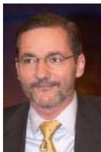
Matthias Platzeck Ministerpräsident Brandenburg, SPD

Ich glaube, es ist schon so etwas wie eine historische Zäsur passiert an diesem 22. September, die aber Ergebnis eines Prozesses ist [...]. Sie [die PDS] soll Stimme