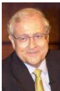
Rainer Brüderle stellv. Vorsitzender der FDP-Bundestagsfraktion

Ich würde lieber über die Frauenpolitik sprechen, für die der Herr Schröder steht und für die der Herr Stoiber steht. Und wieder haben wir diese wunderbare Alternative. Herr Stoiber schlägt vor zum Beispiel, dass jetzt ein Familiengeld eingeführt wird, 600 Euro. Ich würde sagen, das ist eine Herdprämie, um die Frauen schön zu Hause zu belassen.