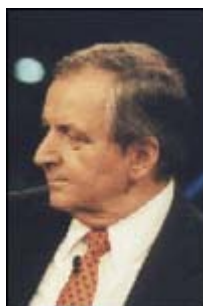
Klaus Töpfer UN-Generaldirektor für Umwelt

europäischen Bereich zugenommen haben. Es ist nur aus meteorologischer Sicht nicht einsehbar, dass das auf eine, vom Menschen verursachte Erwärmung zurückzuführen ist. [...] Wenn man sich diese Temperaturdatenreihen [die 300 Jahre zurückgehen] anschaut und analysiert, dann stellt man fest, dass die 1790er Jahre in Mitteleuropa genauso warm waren wie die 1990er. 1790 sind noch alle mit der Postkutsche gefahren. Wir hatten noch keine Industrialisierung. Das heißt also, wir müssen auch eine Vielfalt von natürlichen Klimafaktoren haben, die unser Klima ständig verändern. Das Klimasystem ist komplex, und es hat immer Klimaänderungen gegeben. [...] Nach den 1790er Jahren gab es hier in Mitteleuropa einen dramatischen Temperaturrückgang bis etwa 1850. [...] Das Ergebnis meiner Untersuchungen ist, in den vergangenen 140 Jahren hat die gesteigerte Sonnenaktivität zwei Drittel der Erwärmungen ausgemacht und der Mensch ist in dem letzten Drittel enthalten. Das heißt, für die Vergangenheit wird - meiner Ansicht nach - der menschliche Einfluss überschätzt. Was aber nicht automatisch heißt, dass das so bleibt.