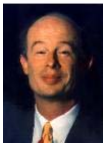
Hans-Joachim Schellnhuber Klimafolgenforscher