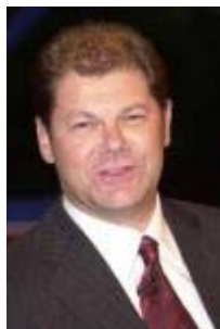
Olaf Scholz designierter SPD-Generalsekretär

Die Bundesregierung hat sich vorgenommen - und wir haben uns vorgenommen für die Koalitionsverhandlungen, - dass es keine Steuererhöhungen geben wird und dabei bleibt es auch. Natürlich gibt es jetzt eine breite Debatte. Was das Verfassungsorgan Bundesrat mit einer gemeinsamen Entschließung von CDU-Ministerpräsidenten und sozialdemokratischen Ministerpräsidenten und einer Ministerpräsidentin eventuell beschließt, können wir in den