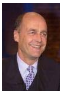
Laurenz Meyer CDU-Generalsekretär

Ich glaube nämlich in der Tat, dass aus vielen rechtlichen Gründen der Spielraum beim Familiensplitting viel kleiner ist, als das unser Koalitionspartner sich das gegenwärtig noch vorstellt. Und das werden wir deshalb auch im Einzelnen diskutieren.