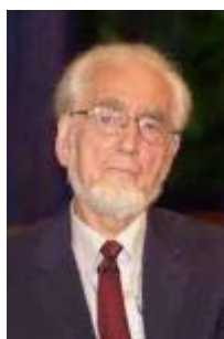
Erhard Eppler SPD-"Urgestein"

Ich wehre mich immer, wenn man sagt, dies und das gehört nicht in den Wahlkampf. Ist es denn was Schlimmes der Wahlkampf? Es ist eine Hochzeit der Demokratie! Das Gespräch derer, die ein Mandat erwerben, mit den Wählerinnen und Wählern. Da gehört alles 'rein, was die Menschen interessiert.