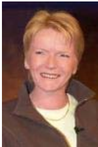
Gabriele Zimmer Parteivorsitzende, PDS

Eines der eigentlichen Probleme insbesondere für die alten Bundesländer ist, dass wir in der Tat eine Menge Beamte haben - so wie Herr Späth mal einer war - , dass wir diese Pensionen jetzt für diese Beamten zahlen müssen Und dass nur wenige, nämlich die Angestellten und Arbeiter, die gesamte Last tragen für die Renten, für die Arbeitslosigkeit. Deshalb würde ich gerne mit Ihnen gemeinsam [zu Herrn Späth] und dafür braucht man eine Zweidrittelmehrheit im Bundestag dafür sorgen, dass wir hier solidarischer sind, dass auch Beamte ihren Beitrag leisten, dass wir damit nicht nur die ganze Last bei den Angestellten und den Arbeitern haben.