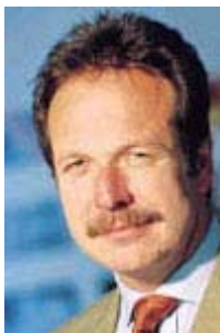
Frank Bsirske Gewerkschaftschef ver.di

Die ostdeutschen Länder sind die ärmsten Länder der ganzen Bundesrepublik. Es ist völlig ausgeschlossen, dass diese Länder eine solche Forderung [Lohnsteigerung im öffentlichen Dienst] verwirklichen, ohne massiven Personalabbau [...] Der öffentliche Dienst - Sie [zu Bsirske] - vergleichen Äpfel mit Birnen. Im Einzelhandel können sie relativ leicht Ihren Arbeitsplatz verlieren. Im öffentlichen Dienst können Sie ihn nicht verlieren. Sie sind faktisch unkündbar. Sie haben im öffentlichen Dienst nicht nur fast unkündbare Arbeitsverträge, Sie haben eine zusätzliche Versorgung im Alter, die sehr viel Geld kostet und die jedes Jahr mehr Geld kostet, die sonst niemand hat.