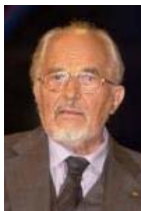
Rainer Barzel ehem. CDU-Vorsitzender

Ich habe den großen Vorteil, beide Kandidaten zu kennen. Und ich war überrascht, dass Stoiber doch recht schlagkräftig war und teilweise sehr charmant. Und ich war erfreut, dass der Bundeskanzler, dem man die Anspannung dieser Tage ansah, so sachlich blieb. [...] Wenn ich mich selbst frage, als Wähler, dann komme ich mir ein bisschen vor wie Faust bei Goethe: "Da steh ich nun, ich armer Tor und bin so klug, als wie zuvor." Denn ich kriegte ja gar keinen Wahlzettel, wo die beiden Namen