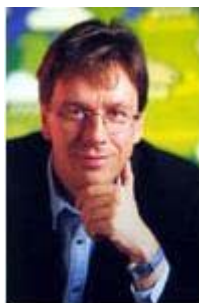
Jörg Kachelmann Meteorologe

In Deutschland sind wir sicherlich nicht führend, was die Warnung vor Naturkatastrophen angeht. Das hat angefangen am Sonntag, als der staatliche Wetterdienst, der eigentlich zuständig ist für solche Warnungen, dummerweise nur eine Vorwarnung zu einer Unwetterwarnung herausgegeben hat. Die hatte eine Fußnote, in der drinstand, dass es noch zu früh sei, genaueres zu sagen und dass später etwas genaueres käme. Am Montag haben wir vom MDR- und ARD-Wetterstudio aus geschrieben, dass es eine Katastrophe ungeahnten Ausmaßes und ein Jahrhunderthochwasser geben würde. Aber das ist dann von den Behörden immer noch nicht zur Kenntnis genommen worden. Wir haben dort etwas erlebt von vielen Behörden, gerade auch in