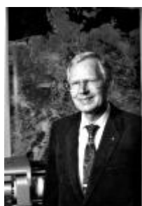
Horst Malberg Meteorologe

Ich glaube, man darf nicht automatisch eine Erwärmung mit einer Zunahme von Katastrophen in Verbindung bringen, bzw. auf gar keinen Fall denken, dass es von Menschen verursachte Ursachen hat. Es ist unbestritten, dass es seit 1850 wärmer geworden ist. Es ist auch unbestritten, dass die Orkantiefs im nordatlantisch/