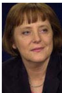
Angela Merkel CDU-Vorsitzende

Ich selbst habe auch meinen Wahlkreis in Mecklenburg-Vorpommern und da weiß man ja, was alles geschaffen wurde, wie lange das gedauert hat und wie schwer es die Selbstständigen auch haben. Es ist schon dramatisch für viele, weil es unendlich viel Kraft, unendlich viel Elan gekostet hat. [...] Jetzt wieder diese Ungewissheit. Das Leben nach der Wende war ja schon für viele mit soviel Neuerungen verbunden, mit soviel Ungewissheiten, und ich bin deshalb auch besonders beeindruckt, dass viele in den anderen Neuen Bundesländern unglaublich solidarisch sind. [...] Wir haben uns jetzt vorgenommen, dass wir von unseren geplanten Anzeigen nur die Hälfte machen und 200.000 Euro spenden wollen. Die CSU 50.000 Euro. Also ein kleiner Beitrag, um vielleicht auch in