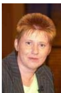
Petra Pau stellv. PDS-Vorsitzende