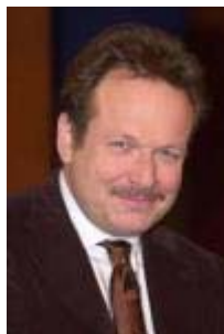
Frank Bsirske ver.di-Chef

Den Frieden kann man nur sichern - aus unserer Sicht jedenfalls - wenn man den Waffeninspektoren die Zeit gibt und die Möglichkeiten gibt, also auch das nötige Druckpotential gibt, das man braucht, damit der Diktator auch mit diesen Waffenkontrolleuren zusammenarbeitet. Wenn man sich hier aus der Solidarität oder aus der Gemeinschaft der Vereinten Nationen heraus begibt, indem man sich vorfestlegt, ohne dass man die Ergebnisse der Kontrolleure kennt, dann nimmt man diesen notwendigen Druck und das ist das Gefährliche dabei. Es ist leider so, dass hier in Deutschland eine Diskussion geführt wird, nach dem Motto, es gibt in der Weltpolitik zu viel Amerika. Ich glaube es gibt in der Weltpolitik zu wenig Europa. Mehr Europa wäre das Bessere und das wird nur gelingen, wenn wir uns in der Völkergemeinschaft mit den Vereinten Nationen darüber verständigen können, dass auch die Vereinten Nationen das Gewaltmonopol haben.