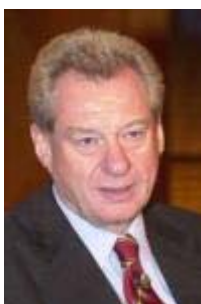
Heinrich Weiss Vorstandsvorsitzender SMS AG

Im Moment machen sie [die Koalitionspartner] doch nichts anderes, als über Zuständigkeiten und über Personen zu reden. Aber wie das [die Reformprobleme] tatsächlich gelöst werden soll, das ist doch nicht erkennbar. Und wenn beispielsweise gesagt wird, jetzt kriegen wir ein großes Superministerium, da wird Wirtschaft und Arbeit endlich zusammen gebracht, wenn da nicht klar auch definiert ist - und man das über diese Diskussion zur Koalitionsvereinbarung auch mal hört, wie denn das zusammengebracht werden soll, dann sag ich Ihnen jetzt schon, dann werden die Arbeitsmarkt-Fördermittel letztendlich versickern, ohne dass Beschäftigungseffekte dabei entstehen. Das haben wir in Thüringen, das haben wir auch in Sachsen erlebt, als die beiden zusammengelegt worden sind.